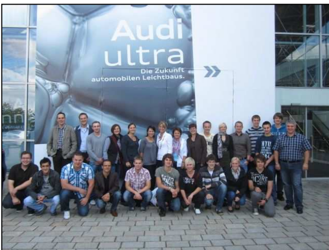
HEINRICHS-Azubis vor dem Audi-Stammwerk in Ingolstadt