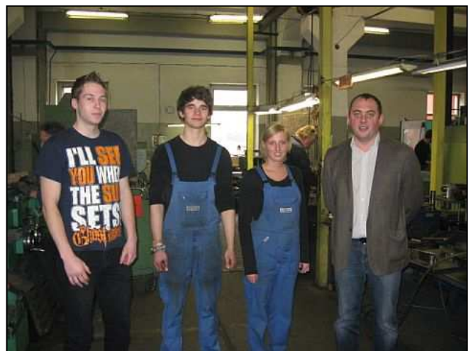
HEINRICHS-Azubis während des Auslandseinsatzes bei Hi-Steel in Kaunas (Litauen)