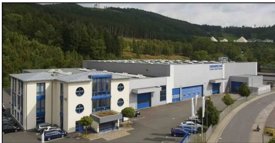
Unser Werk 2 im Industriegebiet Sachtleben

Neben diesen beiden Standorten verfügen wir noch über zahlrei- che weitere nationale und internationale Standorte bzw. Beteili- gungen (u. a. in Litauen und in der Türkei).