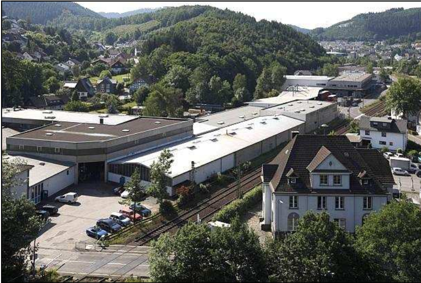
Unser Werk 1 Walzwerkstraße mit Verwaltung

HEINRICHS GmbH & Co. KG ist Zulieferer der Automobilindu- strie und vieler weiterer anderer Industriezweige. Mit aktuell über 270 Mitarbeitern in zwei Werken zählen wir zu den größten Industriebetrieben in Lennestadt mit Sitz in Meggen.