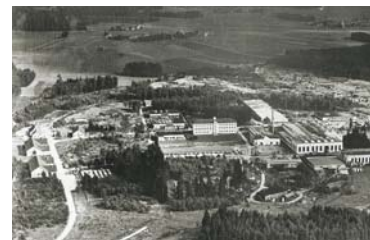
Der Standort Traunreut 1954

Die Fabrik in Traunreut wurde 1949 von der Siemens AG gegründet und ist heute der weltweit größte Produktionsstandort der BSH für Herde, Backöfen und Kochfelder.