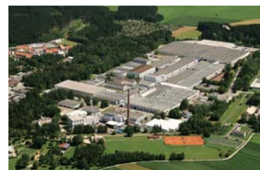
Der Standort Traunreut 2010

Mit über 2.000 Beschäftigten ist die BSH in Traunreut einer der größten Arbeitgeber im Landkreis Traunstein.