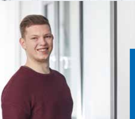
derzeit Student im dualen Bachelorstudiengang Wirtschaftsinformatik

„Im Rahmen meines dualen Studiums habe ich viele unterschiedliche Abteilungen bei NORD kennengelernt, beispielsweise das Controlling, die Personalabteilung, das Global Assembly Management, den Vertrieb – und natürlich die unterschiedlichen IT-Abteilungen. Derzeit arbeite ich als SAP-Berater. Das bedeutet: Ich nehme Anforderungen aus den Fachabteilungen auf und erarbeite auf deren Basis Konzepte und Lösungen, die die Arbeit mit dem SAP-System verbessern.“