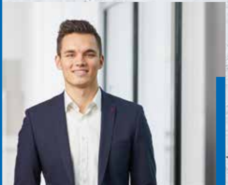
ehemaliger Auszubildender zum Industriekaufmann