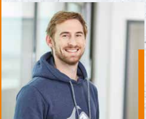
ehemaliger Student des dualen Studiengangs Wirtschaftsingenieurwesen