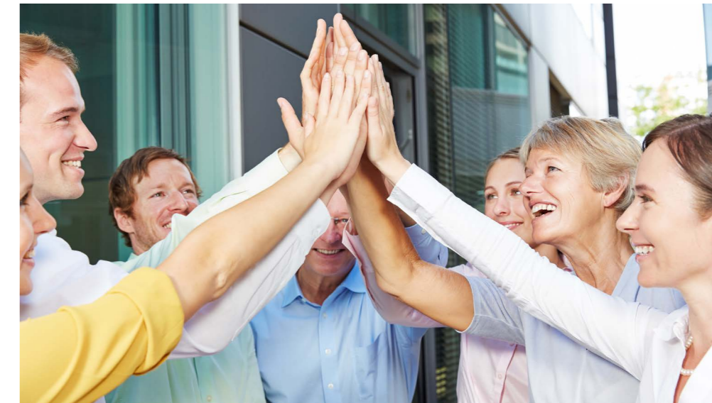
Ausbildung bei Heinlein Plastik-Technik GmbH

Vielseitig, spannend, wert(e)voll – so macht Karriere Spaß!